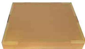
Imballi in cartone