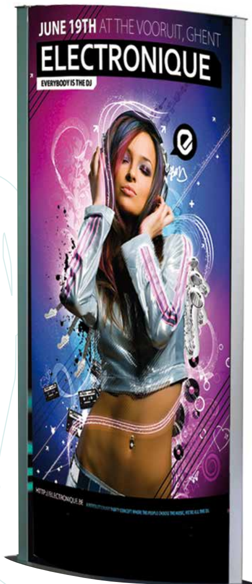
Pannelli non inclusi

Media Pannelli in PVC da 3 mm; opalino da 2 mm.