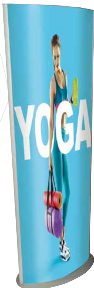
Comprendo di pannelli