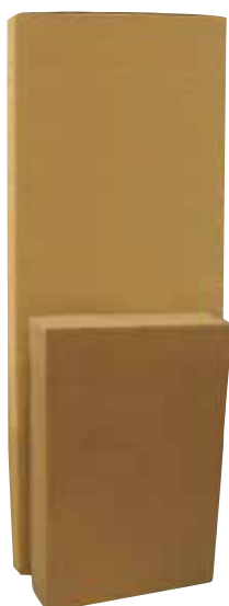
Imballi in cartone