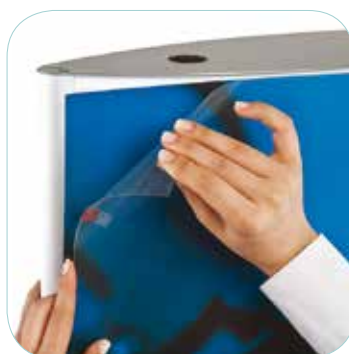
COMPATTO E RAFFINATO

Media Pannelli in PVC da 2 mm; opalino da 2 mm.