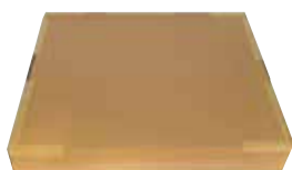
Imballo in cartone