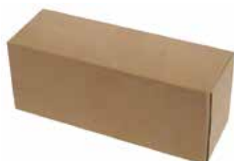
Imballo in cartone