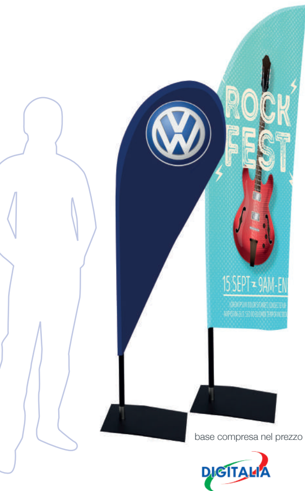
base compresa nel prezzo