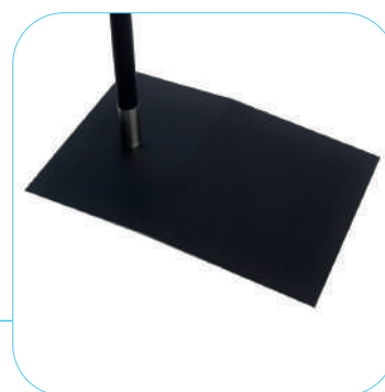
BASE COMPRESA NEL PREZZO