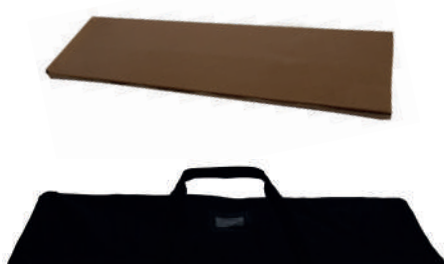
Borsa e imballo in cartone compresi nel prezzo