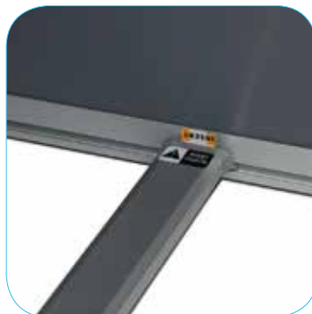
TAPPI LATERALI A PRESSIONE