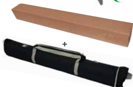
Borsa rigida circolare con scomparto esterno per il piedino