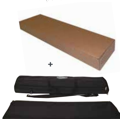
Borsa in nylon doppia