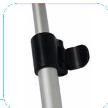
MECCANISMO DI CENTRATURA ASTA VERTICALE