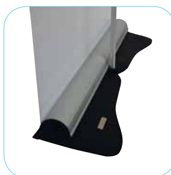
ASTA TELESCOPICA REGOLABILE